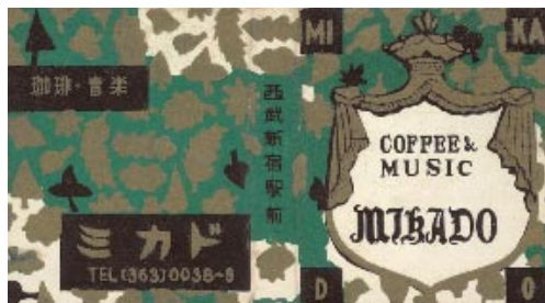
▲珈琲・音楽 ミカド（西新宿駅前）

「あこがれ」はいろいろありました。第14回の章「いま！ゴジラ」で書きましたが、ゴジラが東京都内を破壊して行く様子をテレビ塔から伝えるアナウンサー、映画を観るたびにあこがれました。また、小学生時代の宿題で「子どもニュース」を聞いていましたから、大きな声で自信たっぷり ハヤ にニュースが読めるアナウンサーになりたいと子どもの頃からあこがれていました。そんな時です。「東京でDJ（ディスクジョッキー）喫茶が流行 ハヤ つていて、仙台にもオープンする」と聞いたのは……。